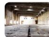
Materialen- en stoffen- inventarisatie