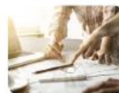
Advies op maat