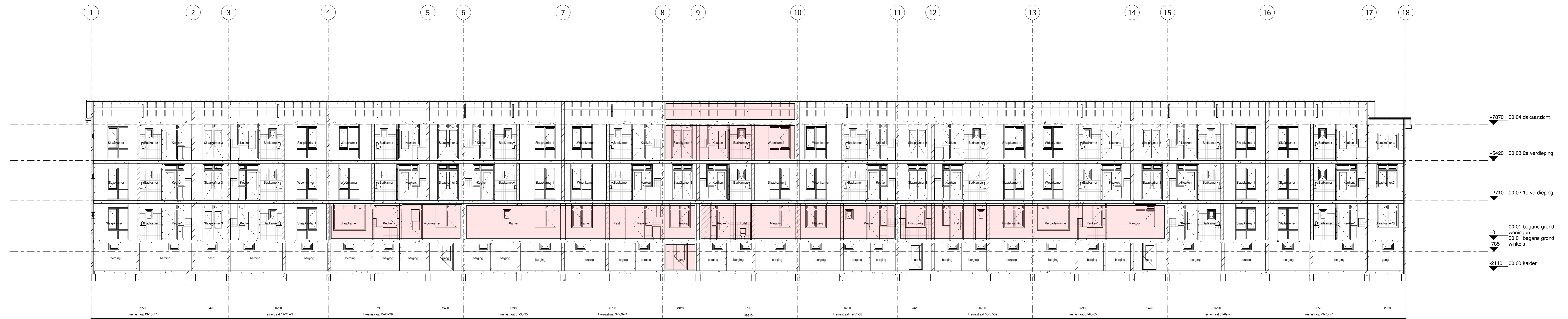
doorsnede B-B schaal 1 : 100