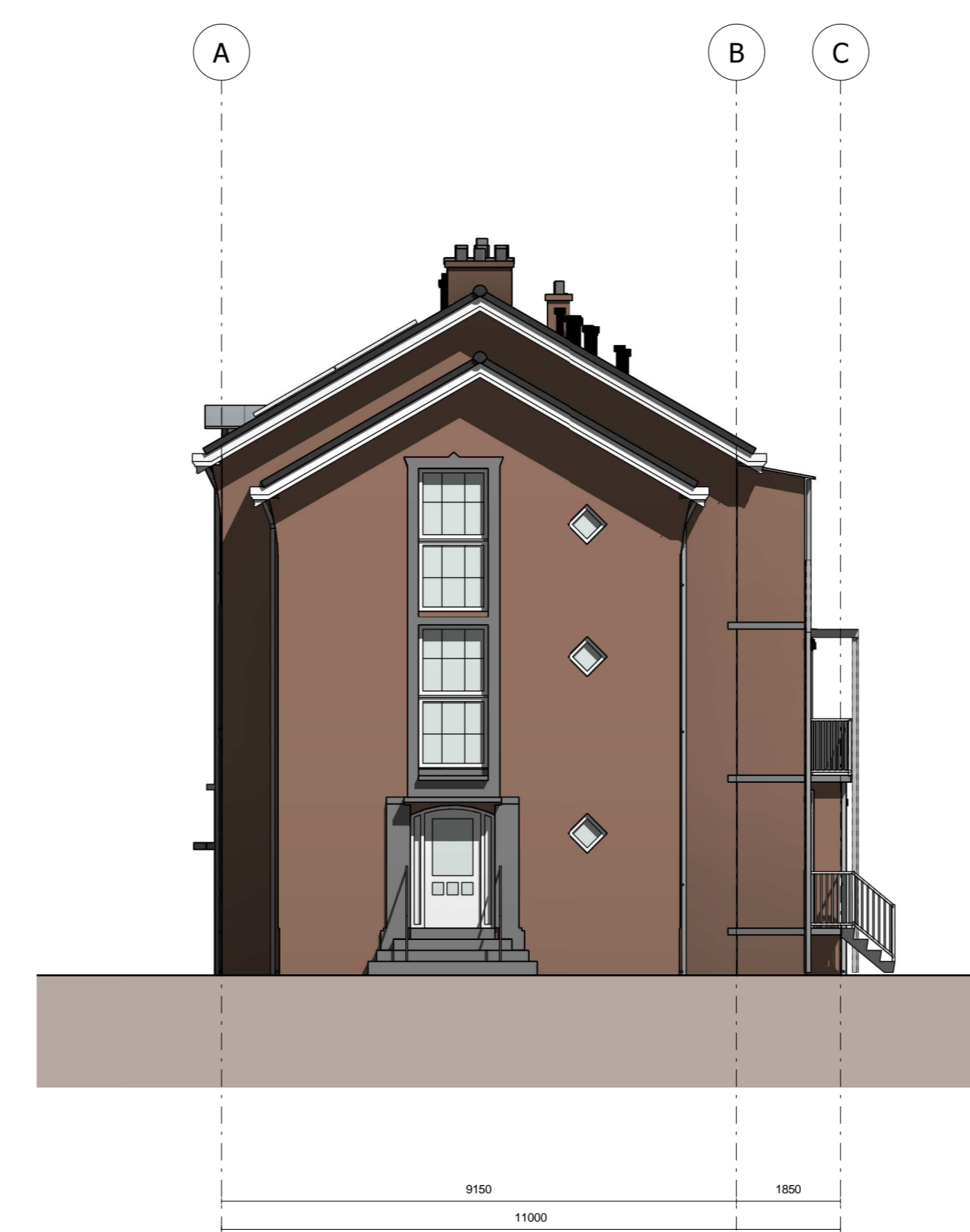
Rechter zij aanzicht schaal 1:100