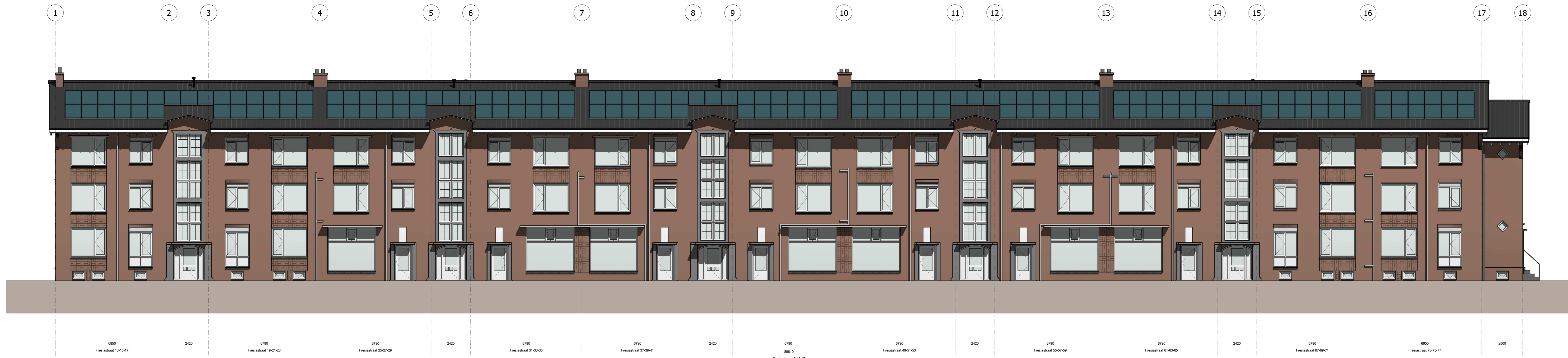
Voorraanzicht schaal 1:100