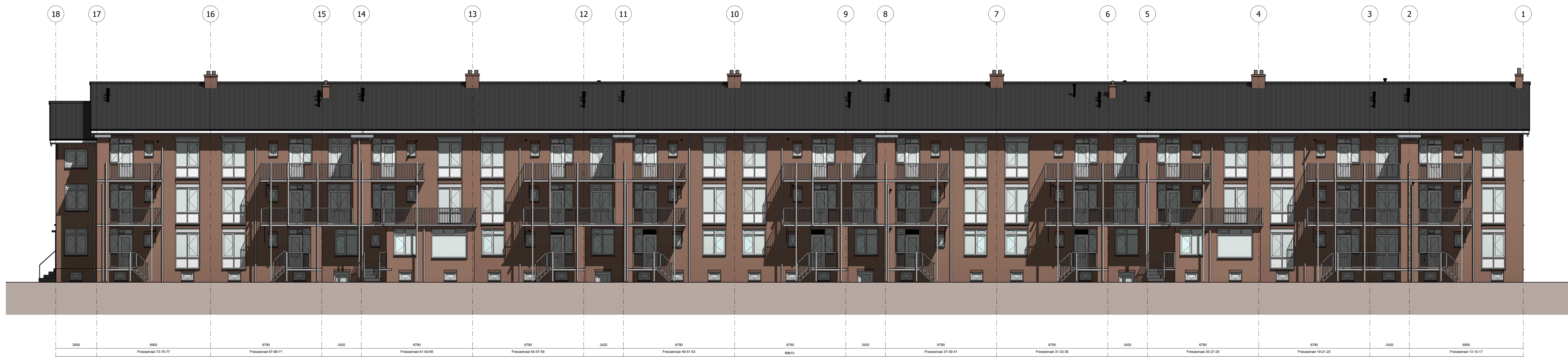
Achteraanzicht schaal 1:100