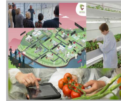
e.g. consortium partner Greenports