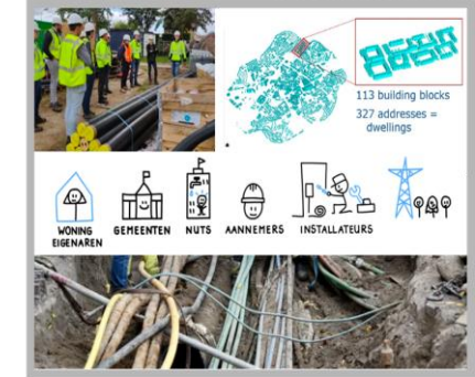
e.g. consortium partner FiDETT