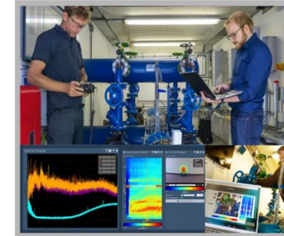
e.g. consortium partner Techport