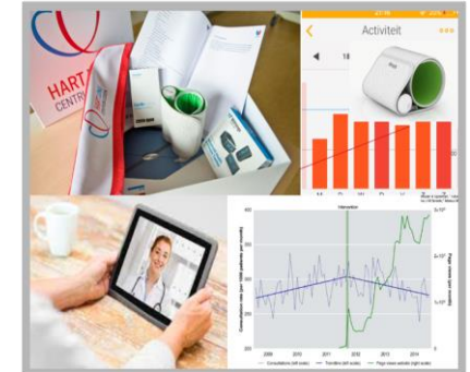
e.g. consortium partner NeLL