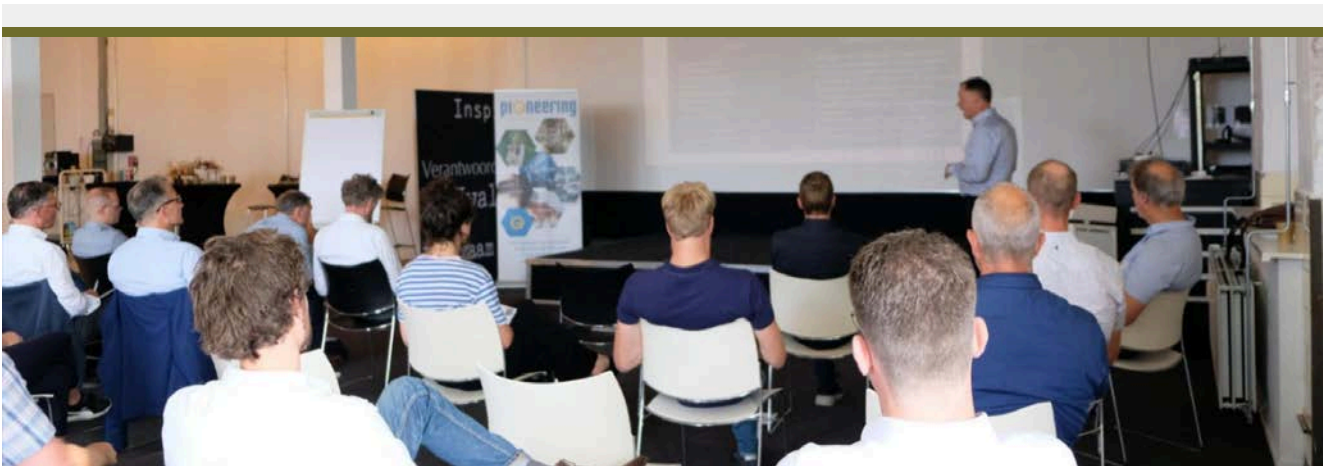
Programma Infra Futurelabs Overijssel