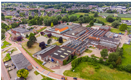
Gemeente Hof van Twente Herbestemming Stoomblekerij Goor