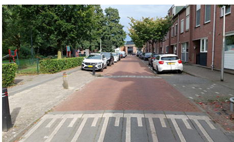
Gemeente Enschede Herinrichting Pluimstraat