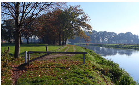
Waterschap Vechtstromen Herstel oevers Lateraalkanaal