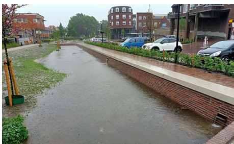
Gemeente Oldenzaal Singelpark