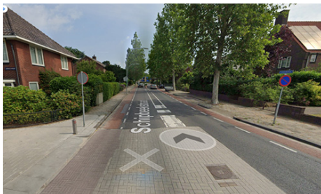
Gemeente Almelo Ondergrondse Blauwe Ader 3