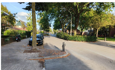
Gemeente Hengelo Herinrichting Achterhoekse Molenweg