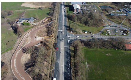
Gemeente Oost Gelre Zieuwentseweg Lichtenvoorde