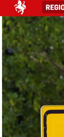
▲ Een verkeersbord van