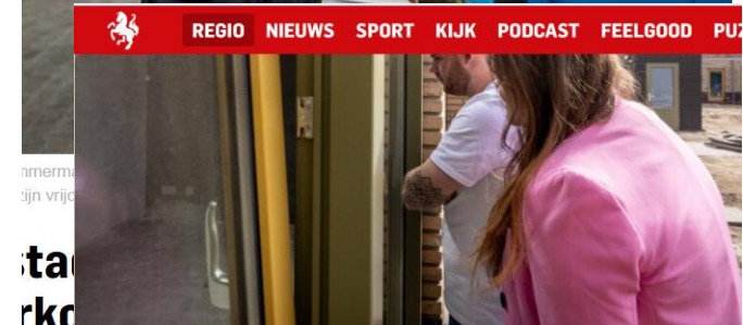
▲ Editie: Alleen maar kijken, er wonen kan voorlopig niet / (inzet: Michel Hasselerharm) © Rikkert Harink / (inzet: Carlo ter Ellen)