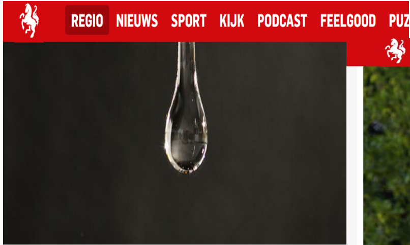
▲ © Carlo ter Ellen DPG Media